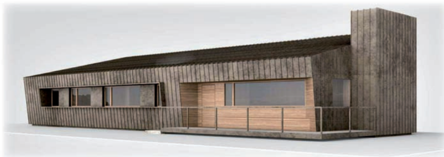
Disegni progetto Bivacco Pradidali