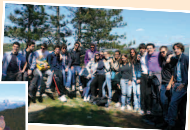
Liceo Marconi Conegliano cl. IV Grotte di San Canziano