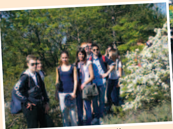
Liceo Marconi Conegliano - Sentiero Kugy