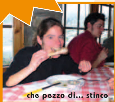
che pezzo di... stinco