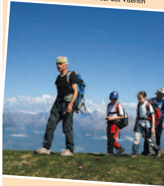
Cresta del Col Visentin