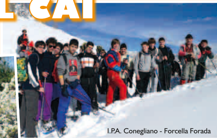
I.P.A. Conegliano - Forcella Forada