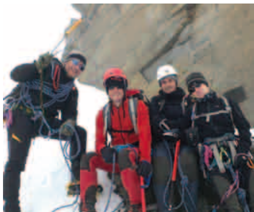
In vetta al Gran Paradiso - 4061m