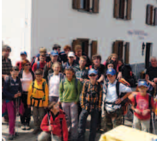
Al Rifugio Tabaretta