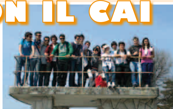
I.T.C. M.Fanno Conegliano - Sentiero Kugy