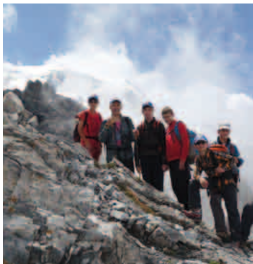
Al Rifugio Payer