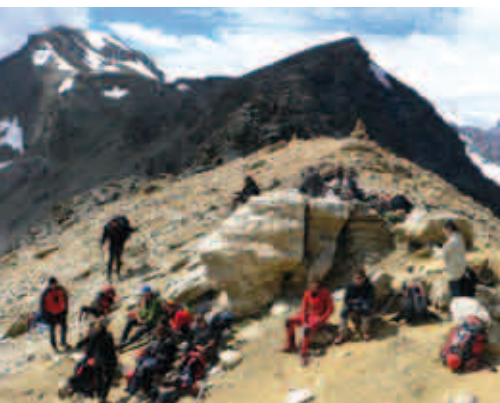
Col Rosset - 3023m