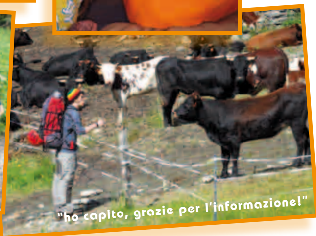
"ho capito, grazie per l'informazione!"