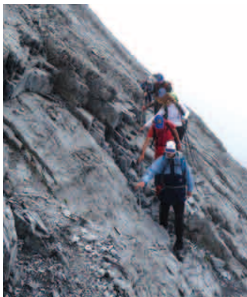
In discesa dal Rifugio Payer