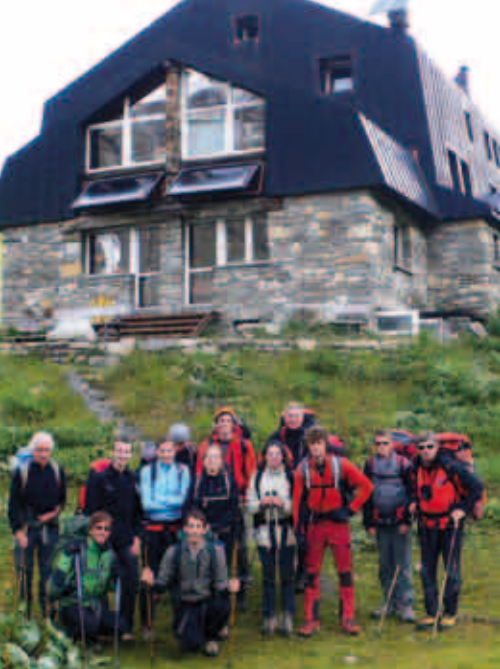
In partenza dal Rifugio Bezzi