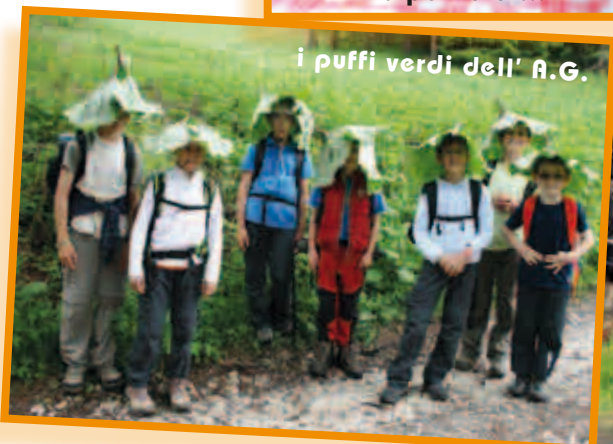
i puffi verdi dell' A.G.