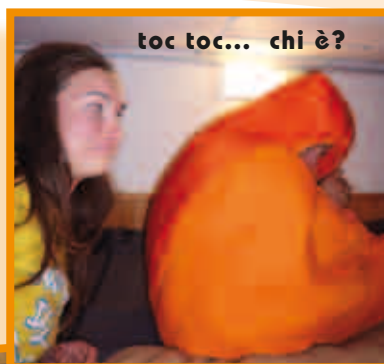
toc toc... chi è?