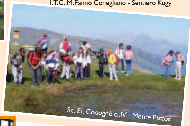
Sc. El. Codognè cl.IV - Monte Pizzoc