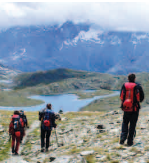
Verso il Rifugio Chivasso