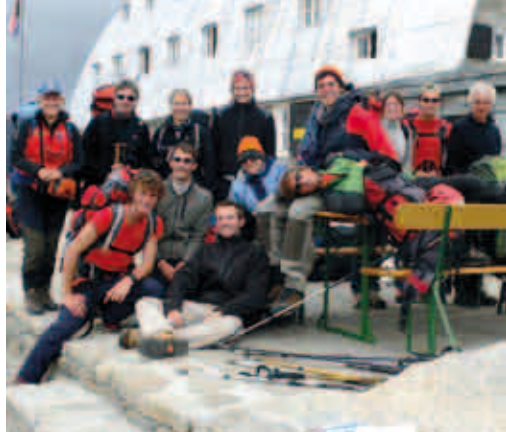
Al Rifugio Vittorio Emanuele - 2732m

Dopo aver fatto un'ottima colazione saliamo sul pullmino che ci condurrà alla stazione di Aosta per il ritorno a Conegliano. Anche quest'anno è stata una bella avventura: il nostro tour nel Parco Nazionale del Gran Paradiso è stato ricco di soddisfazioni e ricordi bellissimi!