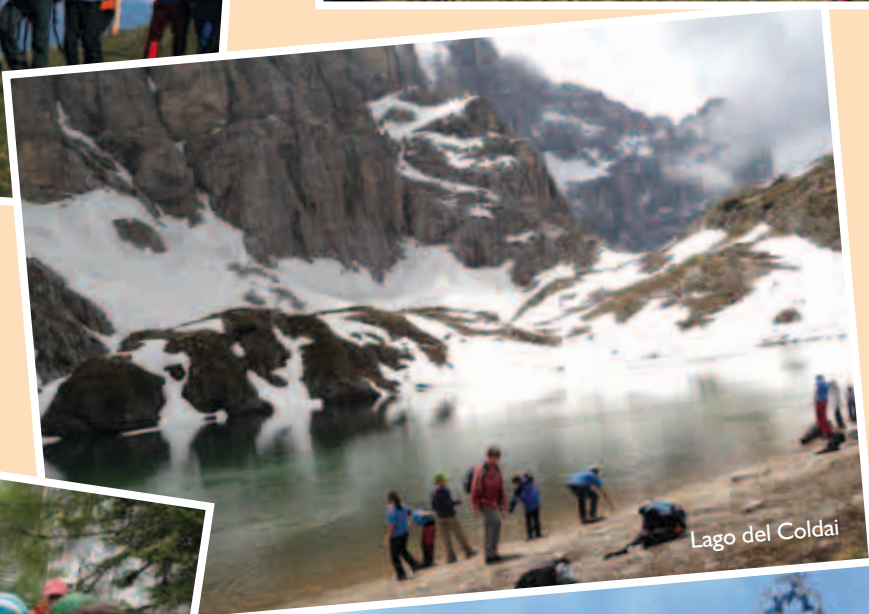
Lago del Coldai