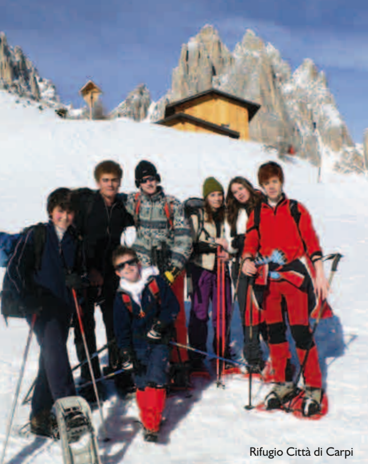
Rifugio Città di Carpi