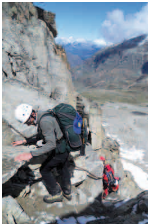
In discesa dal Colle del Gran Neyron - 3295m