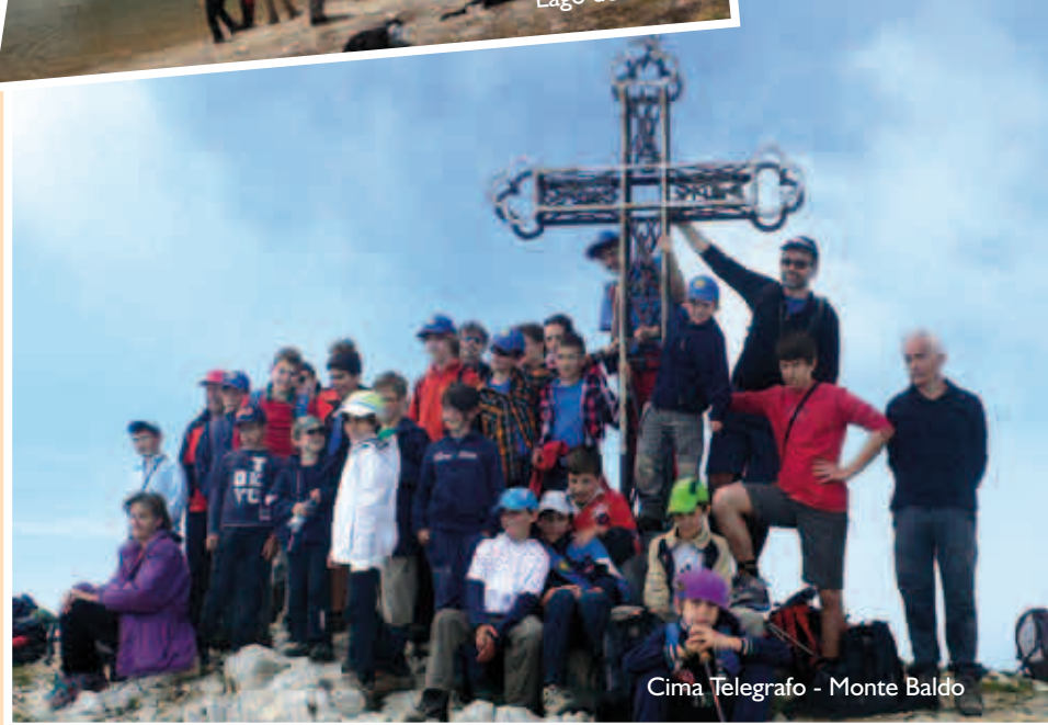
Cima Telegrafo - Monte Baldo