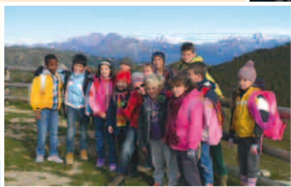
Sc. El. Mazzini Conegliano cl. IV Monte Pizzoc