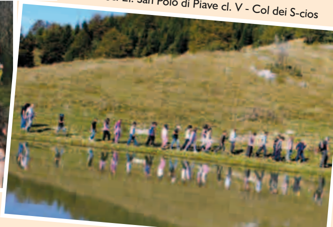
Sc. El. San Polo di Piave cl. V - Col dei S-cios