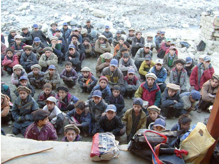
I bambini della scuola