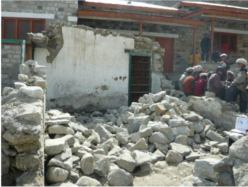
I ruderi della scuola trascinati via dalla forza delle acque