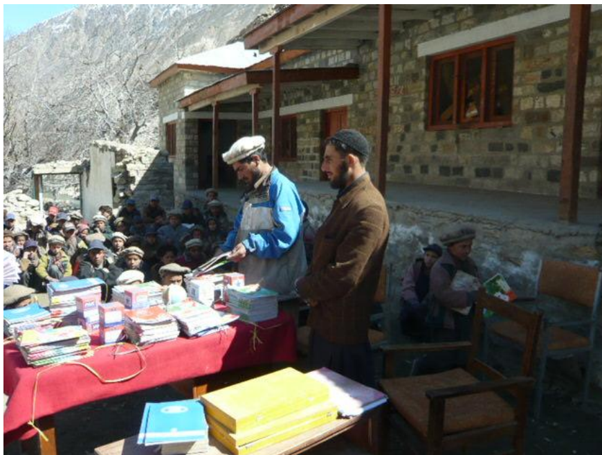
Il dono dei libri ai ragazzi della scuola